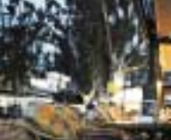
Kreetalaisessa lounassa paikalliset iltavälit usein rannalla, perinteisessä luonnonmukaisessa ympäristössä.

Kreetalaisessa lounassa paikalliset iltavälit usein rannalla, perinteisessä luonnonmukaisessa ympäristössä. Lähes kaikki raaka-aineensa kasvattavat lähes kaikki raaka-aineensa itse. Juuri raaka-aineden laatu (päävauruoreita) on kreetalaisten ylpeyden-aihe. Ruoka on heille hyvin tärkeä asia, paljon enemmän kuin vain energiaa päivän työhön.