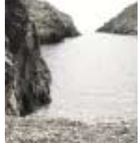
Kali Limenesin riemen takana on laguunamainen lahti.

Kali Limenesissä varsinaista kylää rannalla ei ole, vain panti laivastoa ja vaatimatonta majakka-alueita. Paavalin aikana kymmenkunta kilometriä pohjoisempaan oleva Gortynin kaupunki oli saaren pääkaupunki. Siellä Paavalin uskotaan aloittaneen evankelioimisensa saarella. Huolimatta roomalaisten väkivalta oloista (Paavalia oliin kuljetettavana Roomaan), hän ehti todennäköisesti varsin vapaasti tekemään evankeliointityötään useiden kausien ajan.