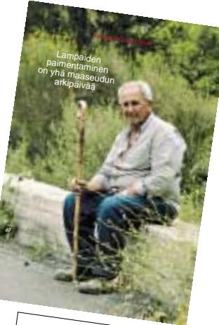
Lämpimän paimentaminen on yhä maaseudun arkipäivää

Rehevästä tuoksuista laaksosta ja rauhallisista oivillehetoista voit nousta vuorten korkouksiin, jyrkille rinteille ja kovin tuuliin. Louhikkoilla rinteiltä voit laskeutua puron varalle kauniiseen kylään.