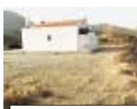
Gortynin muinaiskaupungin laidoilla on edelleen Paavalin saaren "pispa" nimitämän, sittemmin saaren suojeluspyhymykseksi nimetyn Tituksen kirkon rauniot.

Gortynin muinaiskaupungin laidoilla on edelleen Paavalin saaren "pispa" nimitämän, sittemmin saaren suojeluspyhymykseksi nimetyn Tituksen kirkon rauniot. Kali Limenesin edustalla on nykyisin rakennettu muutama öljysäiliö lähelleen saareen, jota vastapäätä riemen yläreunalla on keskiaikainen kaunisti sisustettu kappeli.